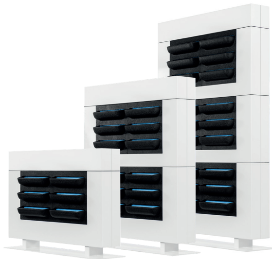
LiveDivider PLUS 1 LiveDivider PLUS 2 LiveDivider PLUS 3

Płyta podstawowa oraz rama LiveDivider PLUS wykonane są z proszkowo lakierowanej stali i w pełni nadają się do recyklingu.